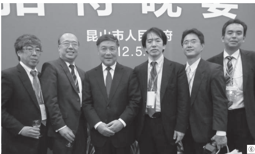
⑤大会セッション風景 ⑥大会参加者たち ⑦⑧中国小売業の状況を紹介するスクリーン