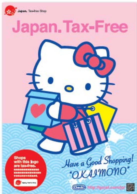
ポスター サイズ: B1