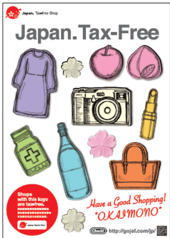
ポスター サイズ: B1