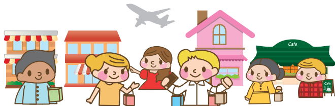
訪日外国人旅行者1人あたりの買物代（国籍・地域別）