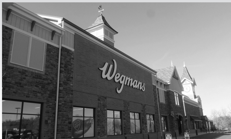
※写真はご訪問先店舗のイメージです