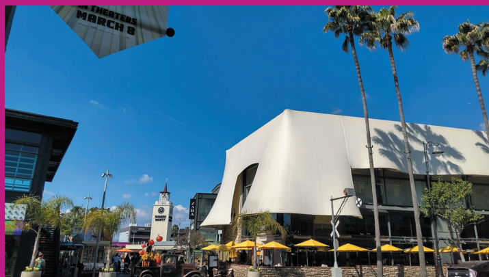
※上記写真はロサンゼルスイメージです