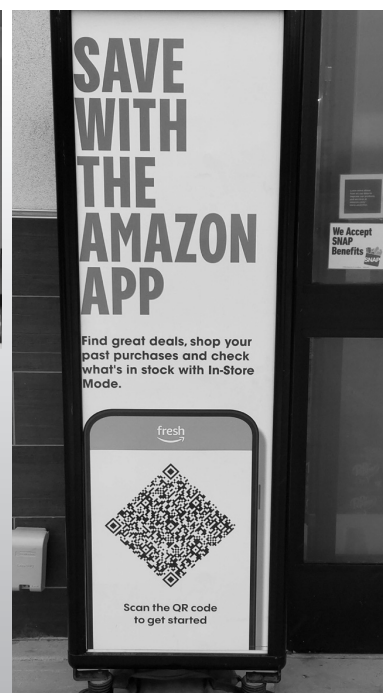
視察先のイメージ